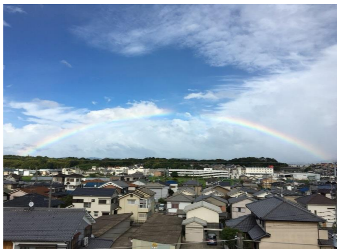
北今市写楽クラブ

自治会では北今市のもの・風景・建物・人物など「北今市の宝物」の写真を募集しています。お持ちの方は下記のメールアドレスまでお送りください。尚、スペースに限りがあり掲載できない場合がございます。ご了承ください。北今市自治会総務広報：kitaimaichi@gmail.com