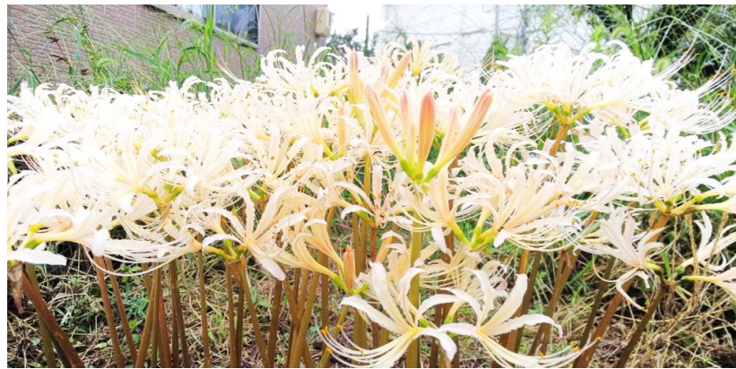
北今市の白い彼岸花