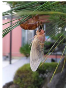
セミの羽化 芳村敏暁

自治会では「北今市の宝物」の写真を募集しています。お持ちの方は下記のメールアドレスまでお送りください。北今市自治会総務広報：kitaimaichi@gmail.com